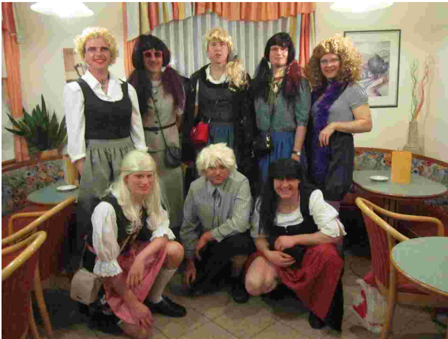
Fischbacher Plattler: Gut getarnt und mit dedektivischem Scharfsinn ausgestattet, gings ab ins Stanzer Damengehege

Frauenball in Stanz. Kein Zutritt für Männer. Ja geht denn das überhaupt? Für die Fischbacher Plattler Grund genug, der Sache auf den Grund zu gehen.